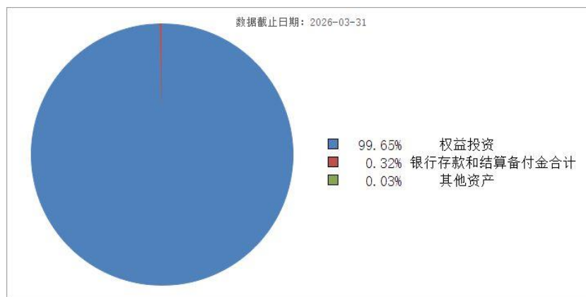
投资组合资产配置图表