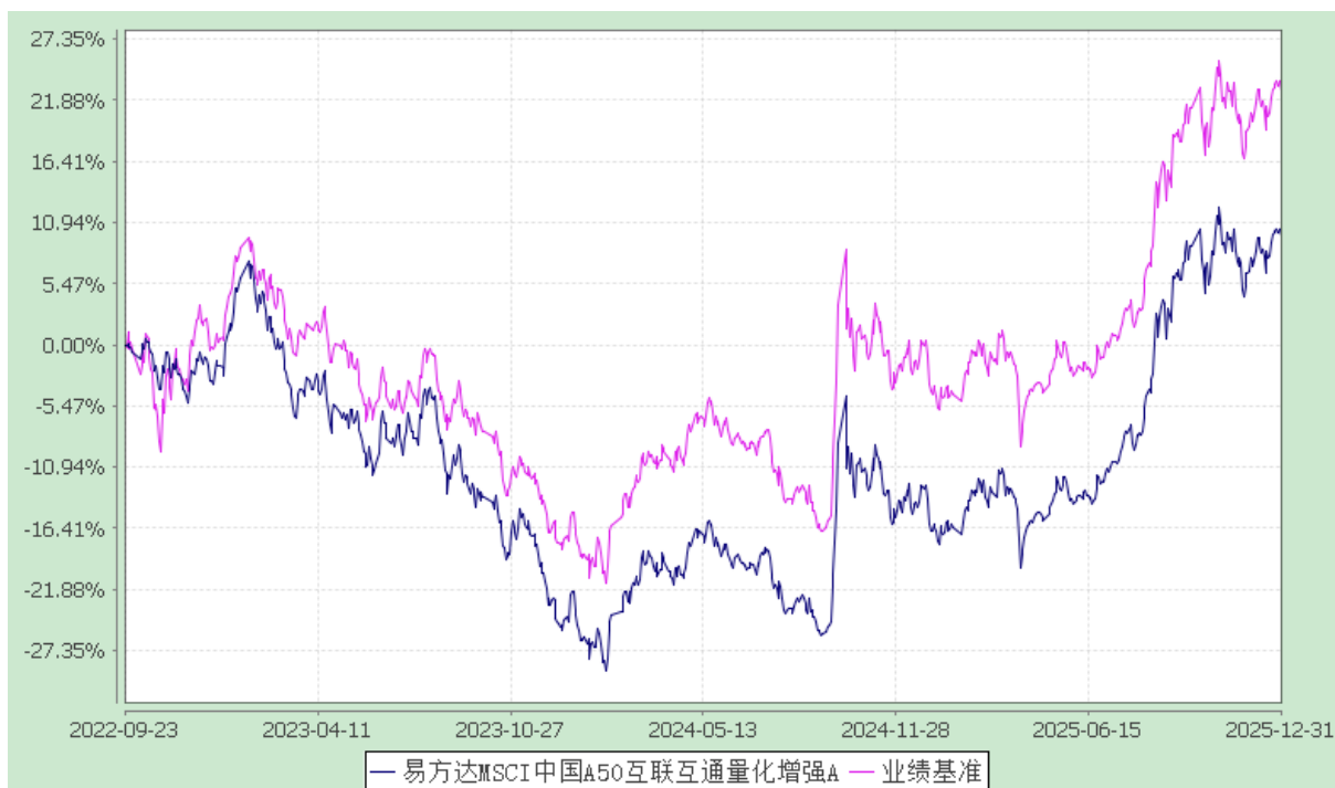
易方达 MSCI 中国 A50 互联互通量化增强 C