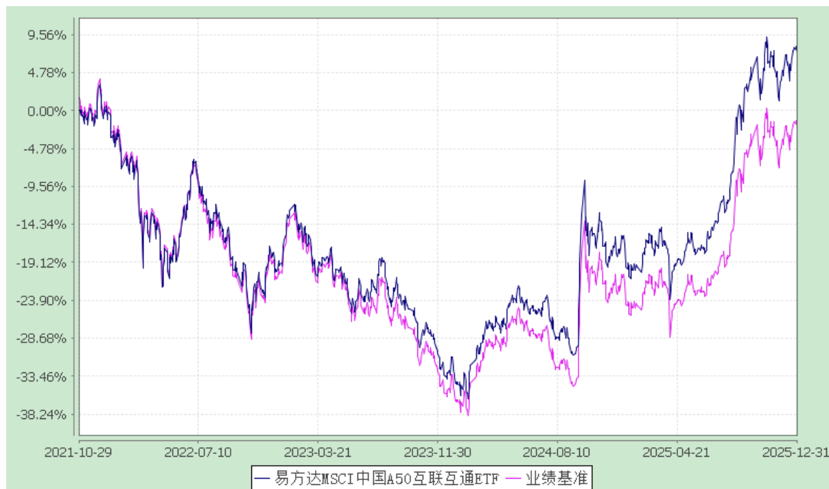
易方达 MSCI 中国 A50 互联互通交易型开放式指数证券投资基金 份额累计净值增长率与业绩比较基准收益率历史走势对比图 (2021 年 10 月 29 日至 2025 年 12 月 31 日)