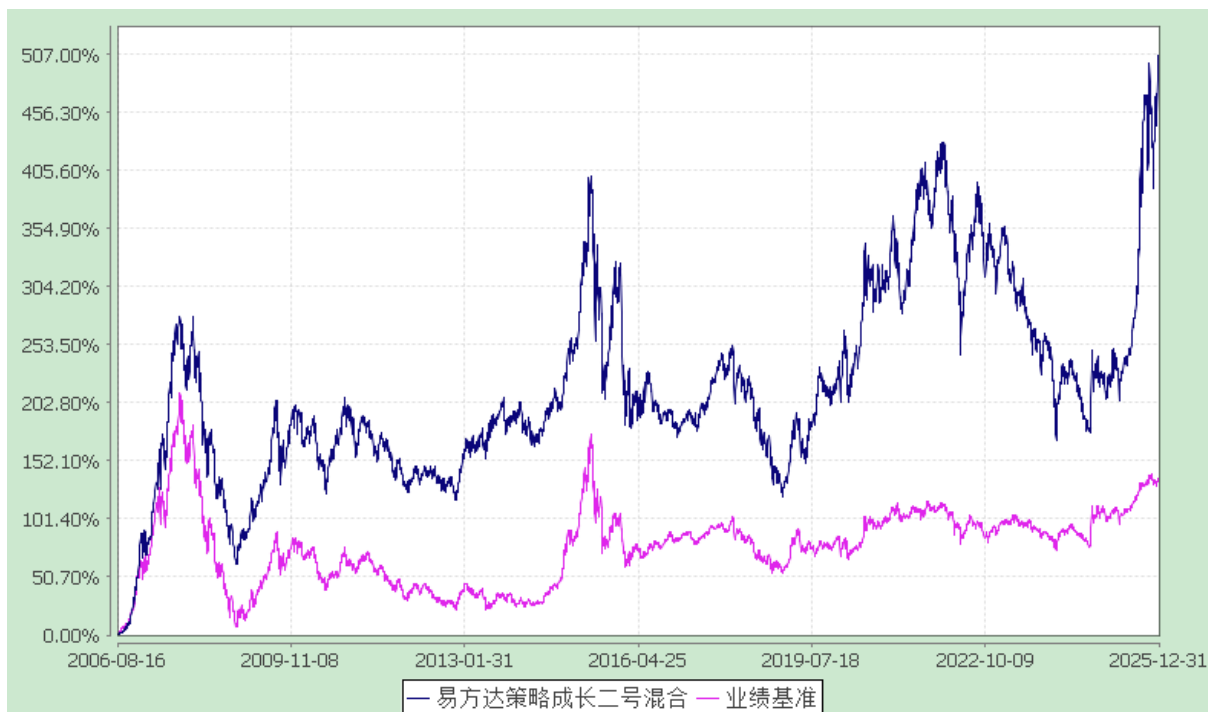
份额累计净值增长率与业绩比较基准收益率历史走势对比图 (2006 年 8 月 16 日至 2025 年 12 月 31 日)