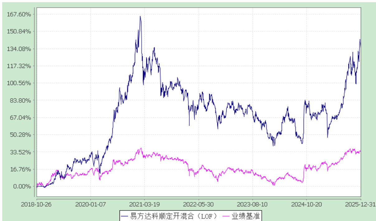
易方达科顺定期开放灵活配置混合型证券投资基金 份额累计净值增长率与业绩比较基准收益率历史走势对比图 (2018 年 10 月 26 日至 2025 年 12 月 31 日)