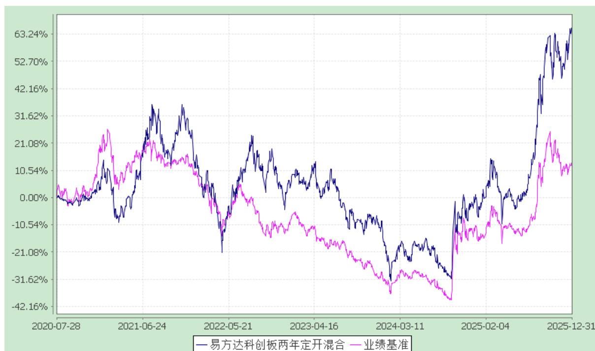
易方达科创板两年定期开放混合型证券投资基金 份额累计净值增长率与业绩比较基准收益率历史走势对比图 (2020年7月28日至2025年12月31日)

注：自 2024 年 7 月 23 日起，本基金业绩比较基准由“中国战略新兴产业成份指数收益率×65%+中证港股通综合指数收益率×10%+中债总指数收益率×25%”调整为“上证科创板 50 成份指数收益率×80%+中证港股通综合指数收益率×5%+中债总指数收益率×15%”。基金业绩比较基准收益率在调整前后期间分别根据相应的指标计算。