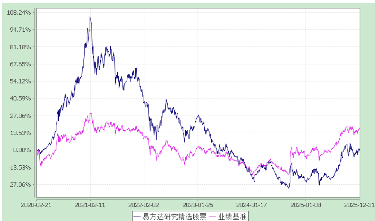
份额累计净值增长率与业绩比较基准收益率历史走势对比图 (2020 年 2 月 21 日至 2025 年 12 月 31 日)