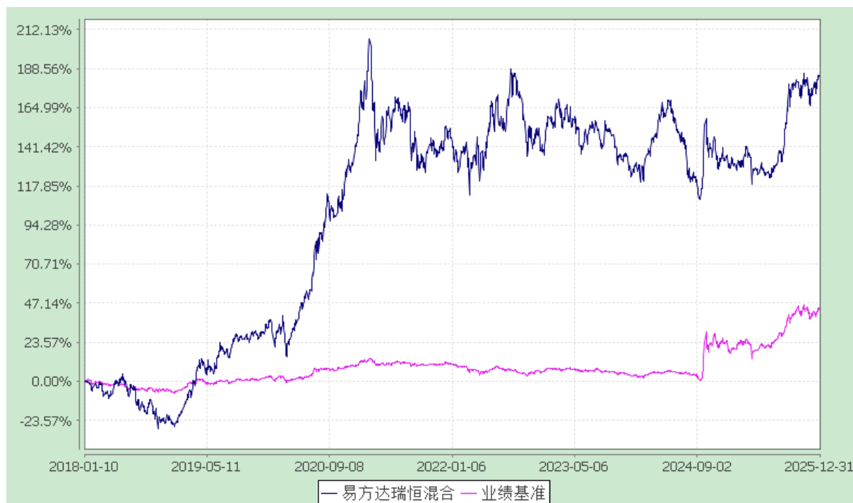
易方达瑞恒灵活配置混合型证券投资基金 份额累计净值增长率与业绩比较基准收益率历史走势对比图 (2018 年 1 月 10 日至 2025 年 12 月 31 日)

注：自 2024 年 8 月 27 日起，本基金业绩比较基准由“沪深 300 指数收益率×25%+一年期人民币定期存款利率（税后）×75%”调整为“中证 800 指数收益率×85%+中债总指数收益率×15%”。基金业绩比较基准收益率在调整前后期间分别根据相应的指标计算。