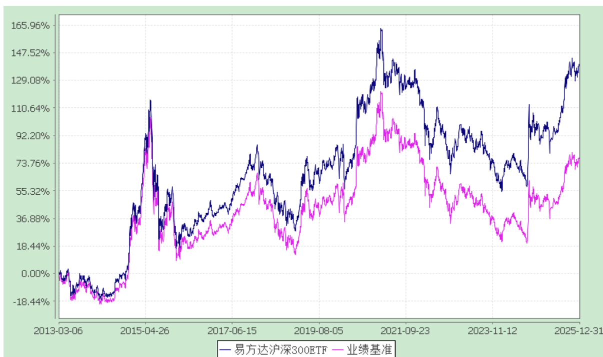
易方达沪深 300 交易型开放式指数发起式证券投资基金 份额累计净值增长率与业绩比较基准收益率历史走势对比图 (2013 年 3 月 6 日至 2025 年 12 月 31 日)