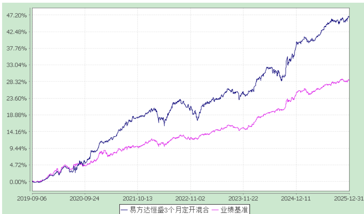
易方达恒盛 3 个月定期开放混合型发起式证券投资基金 份额累计净值增长率与业绩比较基准收益率历史走势对比图 (2019 年 9 月 6 日至 2025 年 12 月 31 日)