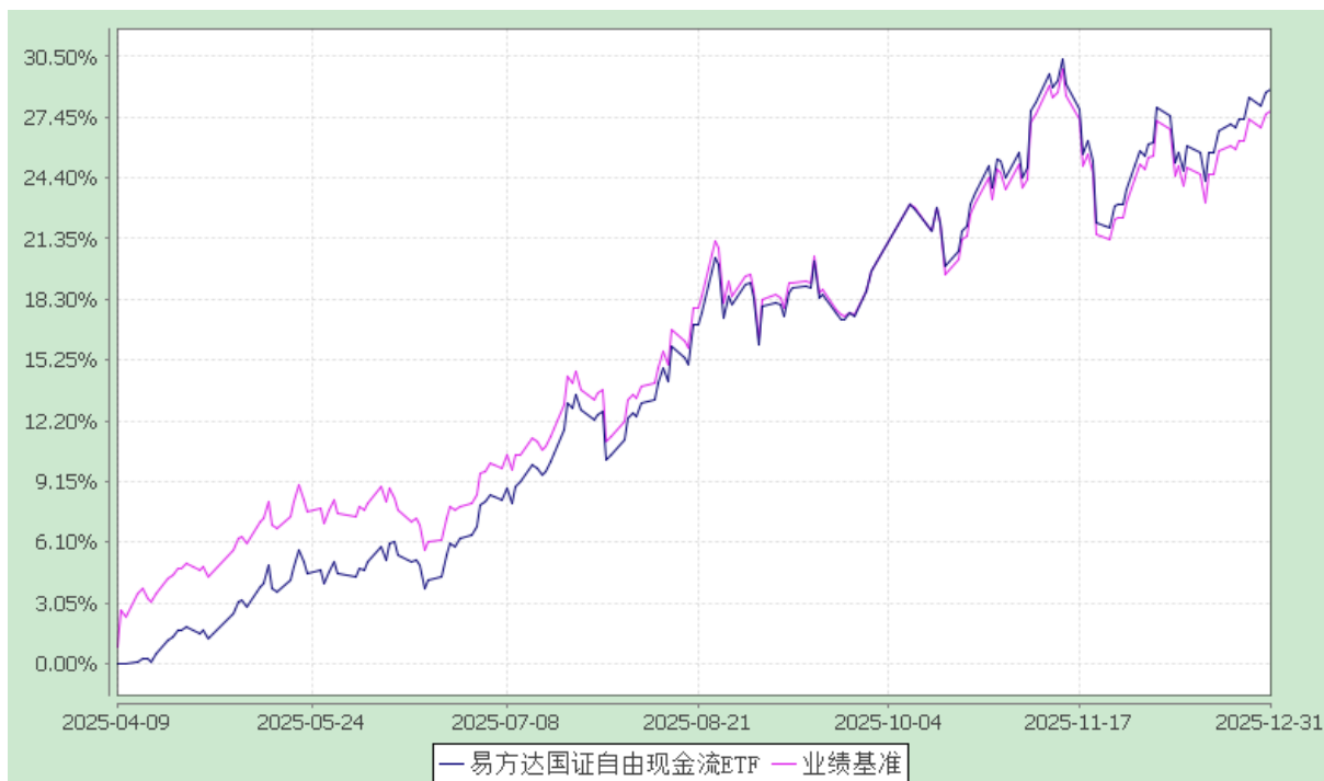
易方达国证自由现金流交易型开放式指数证券投资基金 份额累计净值增长率与业绩比较基准收益率历史走势对比图 (2025 年 4 月 9 日至 2025 年 12 月 31 日)

注：1. 本基金合同于 2025 年 4 月 9 日生效，截至报告期末本基金合同生效未满一年。