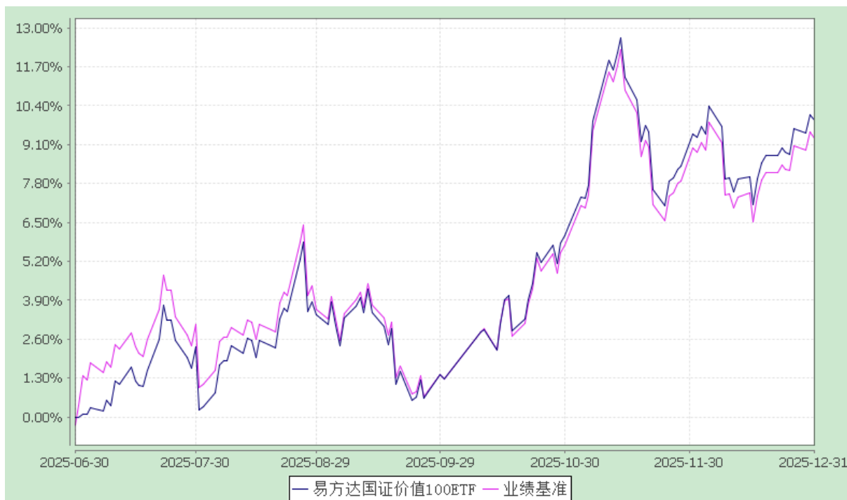
易方达国证价值 100 交易型开放式指数证券投资基金 份额累计净值增长率与业绩比较基准收益率历史走势对比图 (2025 年 6 月 30 日至 2025 年 12 月 31 日)

注：1.本基金合同于 2025 年 6 月 30 日生效，截至报告期末本基金合同生效未满一年。