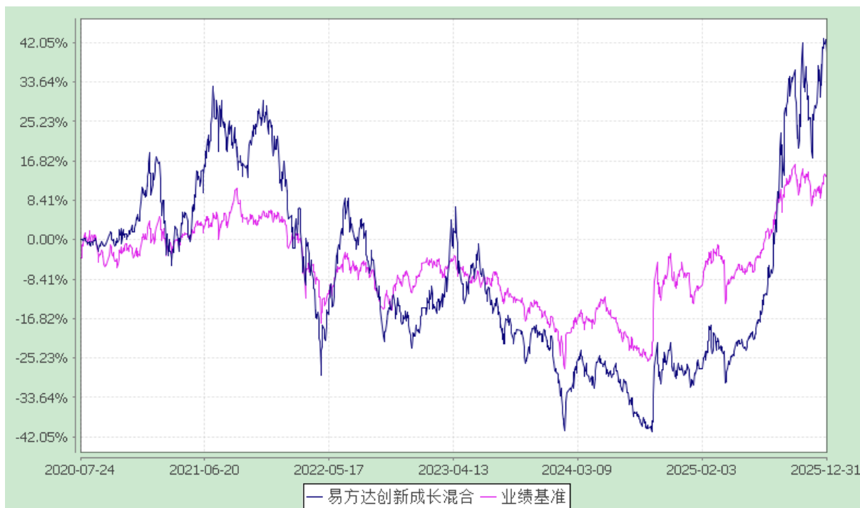
易方达创新成长混合型证券投资基金 份额累计净值增长率与业绩比较基准收益率历史走势对比图 (2020 年 7 月 24 日至 2025 年 12 月 31 日)