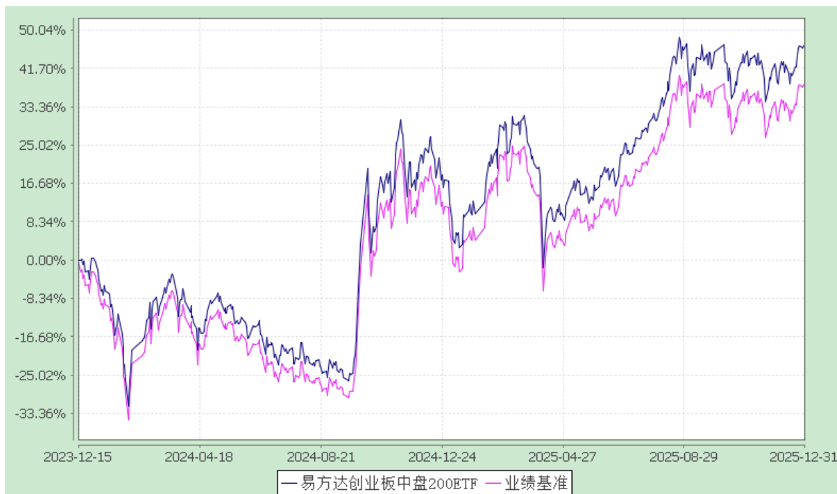
易方达创业板中盘 200 交易型开放式指数证券投资基金 份额累计净值增长率与业绩比较基准收益率历史走势对比图 (2023 年 12 月 15 日至 2025 年 12 月 31 日)