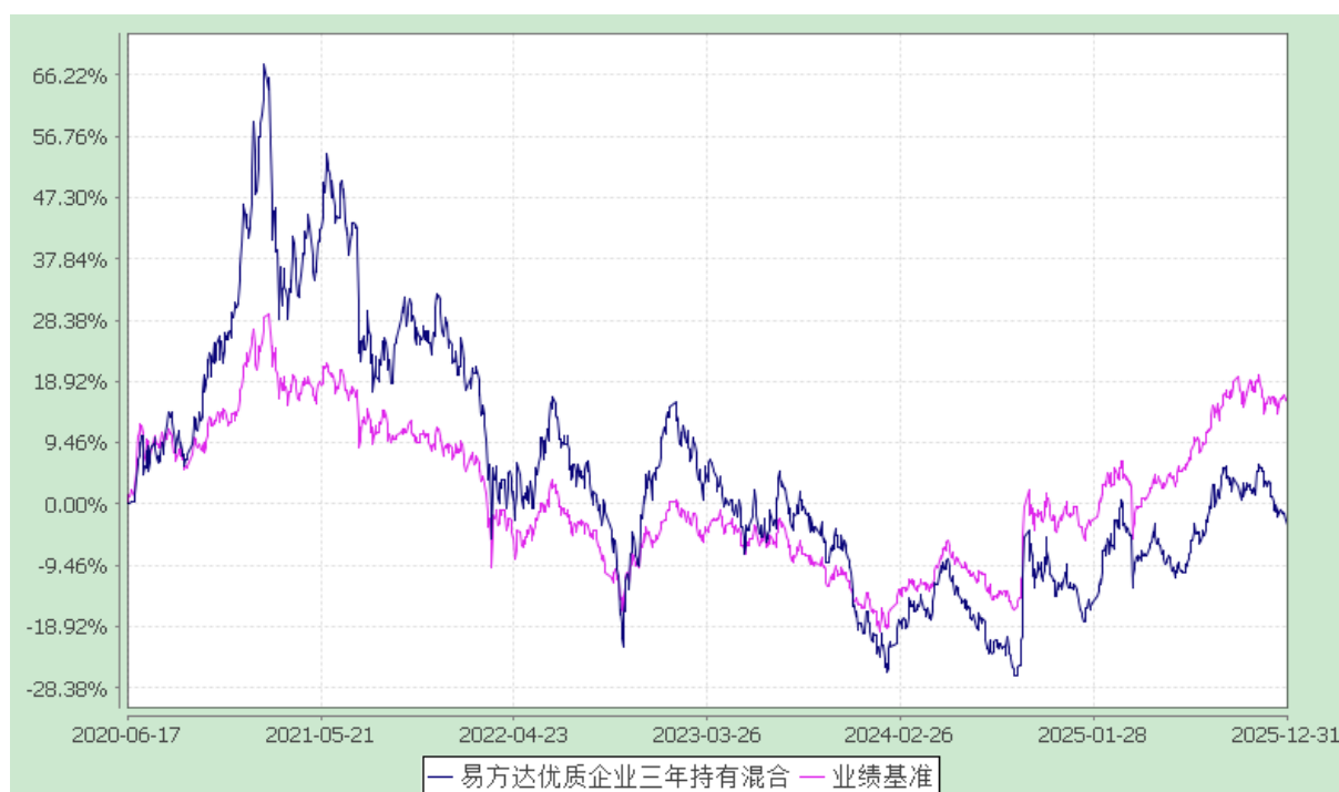
易方达优质企业三年持有期混合型证券投资基金 份额累计净值增长率与业绩比较基准收益率历史走势对比图 (2020年6月17日至2025年12月31日)