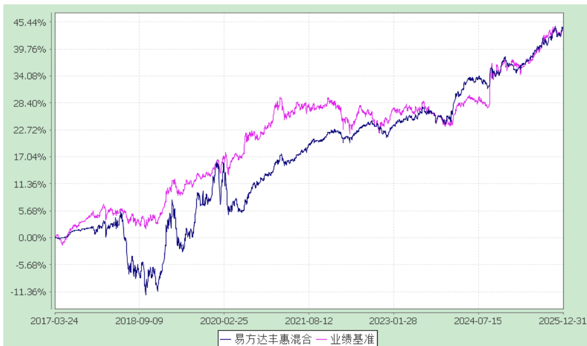
份额累计净值增长率与业绩比较基准收益率历史走势对比图 (2017 年 3 月 24 日至 2025 年 12 月 31 日)