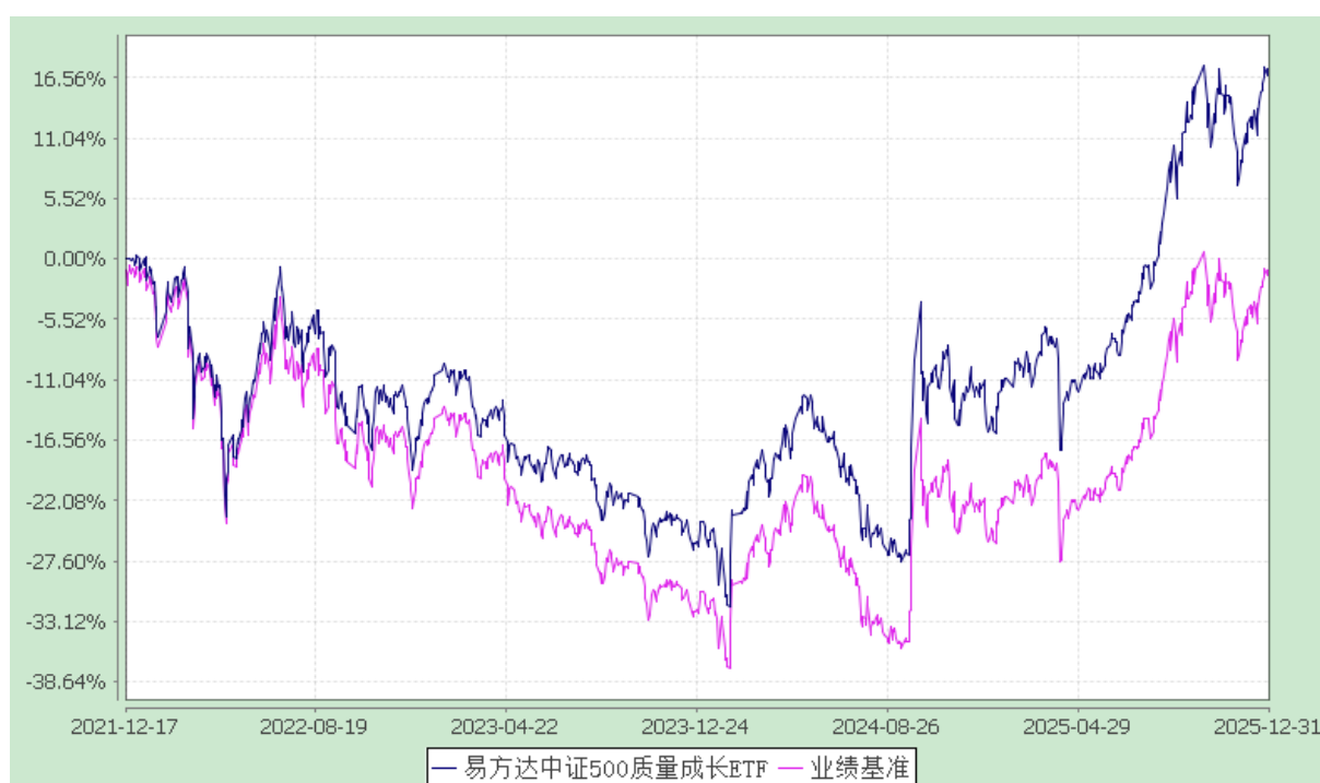
易方达中证 500 质量成长交易型开放式指数证券投资基金 份额累计净值增长率与业绩比较基准收益率历史走势对比图 (2021 年 12 月 17 日至 2025 年 12 月 31 日)