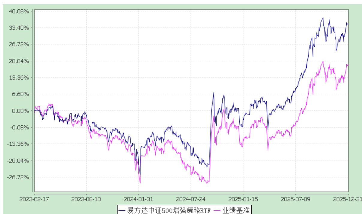
易方达中证 500 增强策略交易型开放式指数证券投资基金 份额累计净值增长率与业绩比较基准收益率历史走势对比图 (2023 年 2 月 17 日至 2025 年 12 月 31 日)