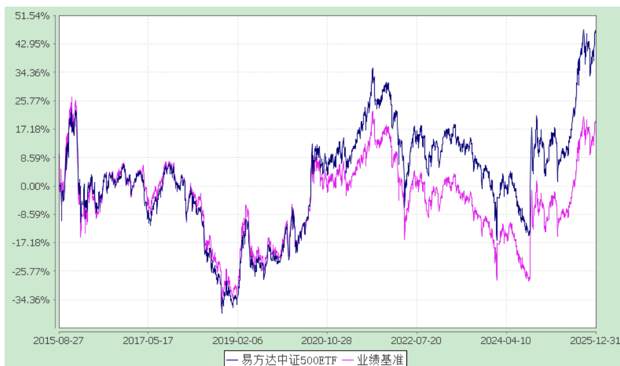
易方达中证 500 交易型开放式指数证券投资基金 份额累计净值增长率与业绩比较基准收益率历史走势对比图 (2015 年 8 月 27 日至 2025 年 12 月 31 日)