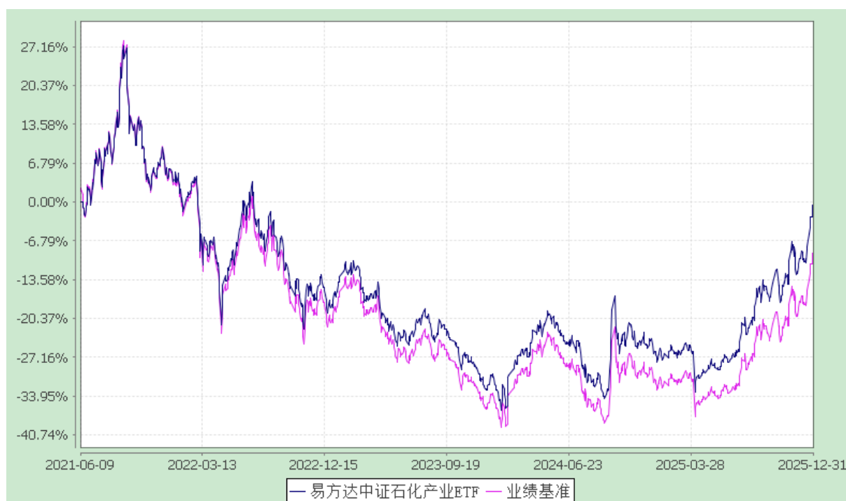
易方达中证石化产业交易型开放式指数证券投资基金 份额累计净值增长率与业绩比较基准收益率历史走势对比图 (2021年6月9日至2025年12月31日)