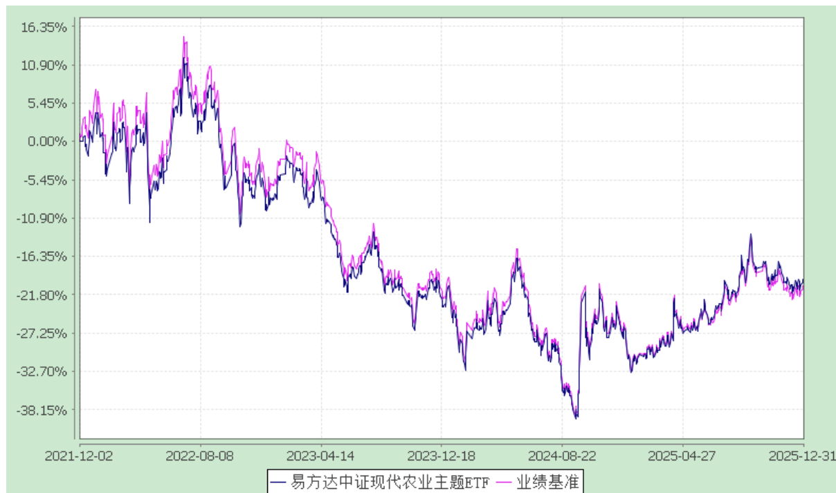
易方达中证现代农业主题交易型开放式指数证券投资基金 份额累计净值增长率与业绩比较基准收益率历史走势对比图 (2021 年 12 月 2 日至 2025 年 12 月 31 日)