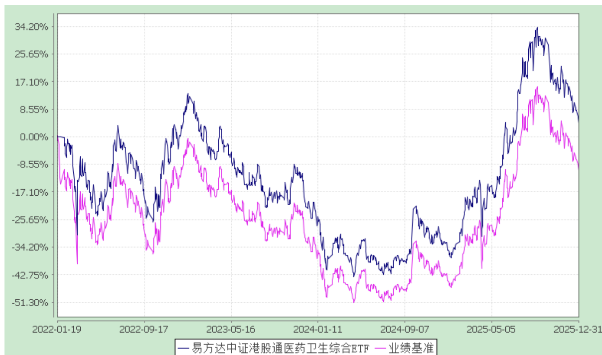
易方达中证港股通医药卫生综合交易型开放式指数证券投资基金 份额累计净值增长率与业绩比较基准收益率历史走势对比图 (2022年1月19日至2025年12月31日)