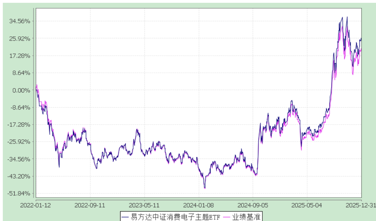
易方达中证消费电子主题交易型开放式指数证券投资基金 份额累计净值增长率与业绩比较基准收益率历史走势对比图 (2022 年 1 月 12 日至 2025 年 12 月 31 日)