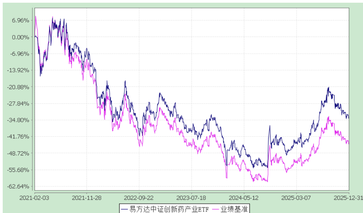
易方达中证创新药产业交易型开放式指数证券投资基金 份额累计净值增长率与业绩比较基准收益率历史走势对比图 (2021年2月3日至2025年12月31日)