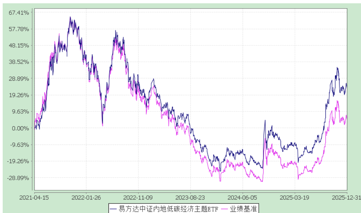
易方达中证内地低碳经济主题交易型开放式指数证券投资基金 份额累计净值增长率与业绩比较基准收益率历史走势对比图 (2021 年 4 月 15 日至 2025 年 12 月 31 日)