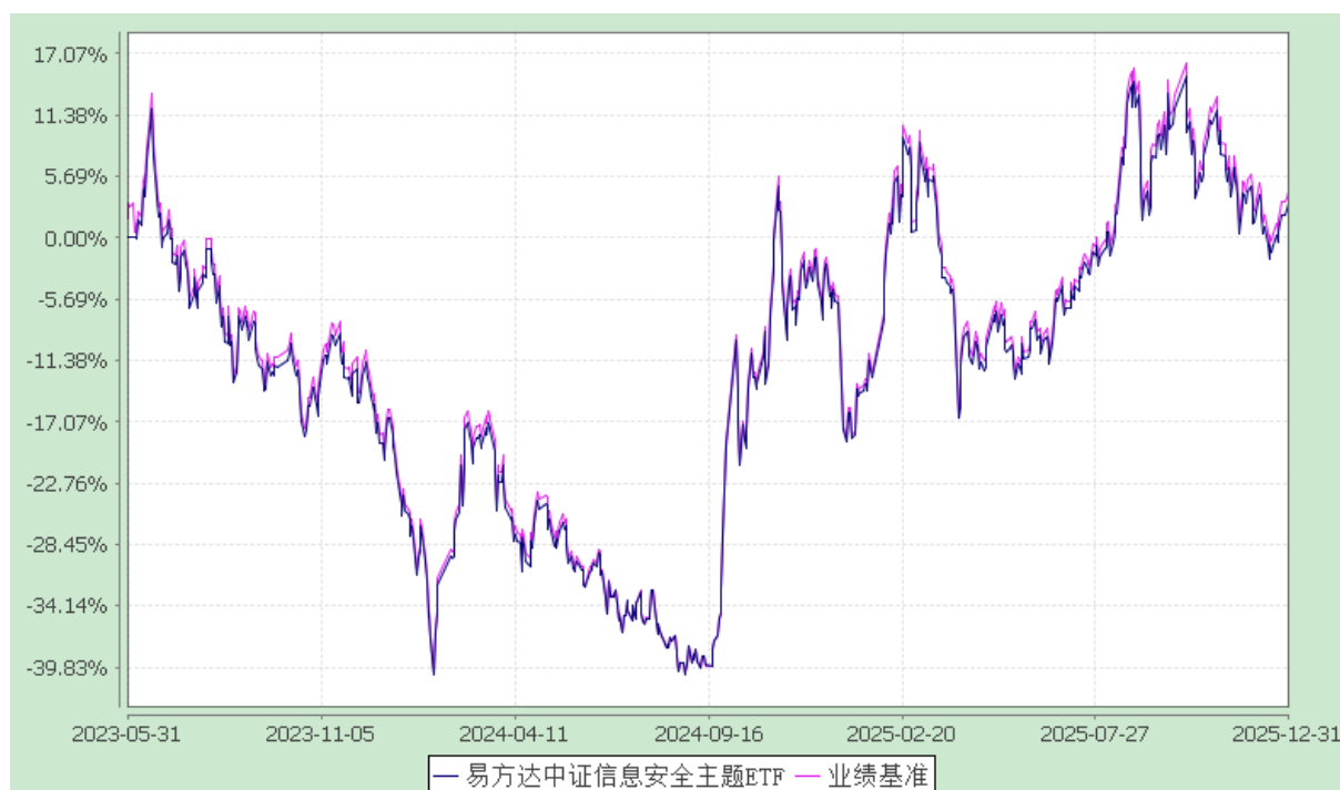
易方达中证信息安全主题交易型开放式指数证券投资基金 份额累计净值增长率与业绩比较基准收益率历史走势对比图 (2023年5月31日至2025年12月31日)