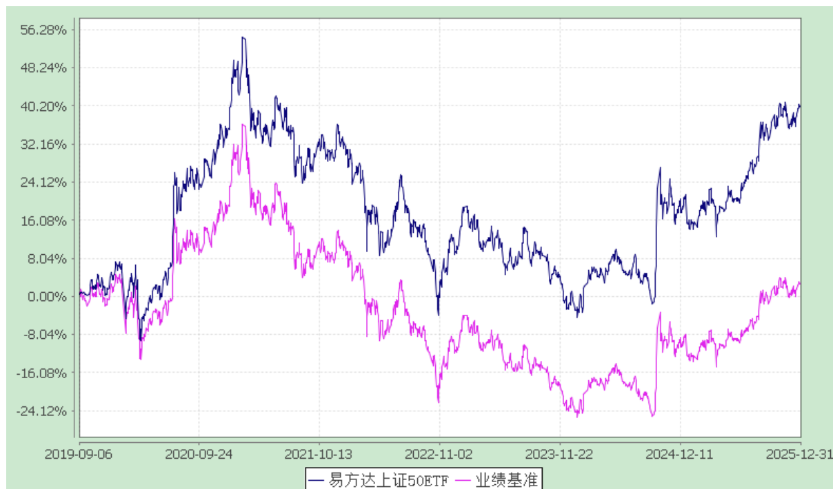
易方达上证 50 交易型开放式指数证券投资基金 份额累计净值增长率与业绩比较基准收益率历史走势对比图 (2019 年 9 月 6 日至 2025 年 12 月 31 日)