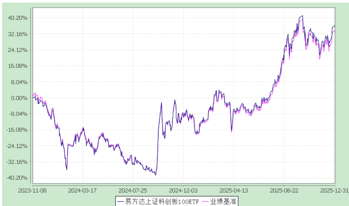
易方达上证科创板 100 交易型开放式指数证券投资基金 份额累计净值增长率与业绩比较基准收益率历史走势对比图 (2023 年 11 月 8 日至 2025 年 12 月 31 日)