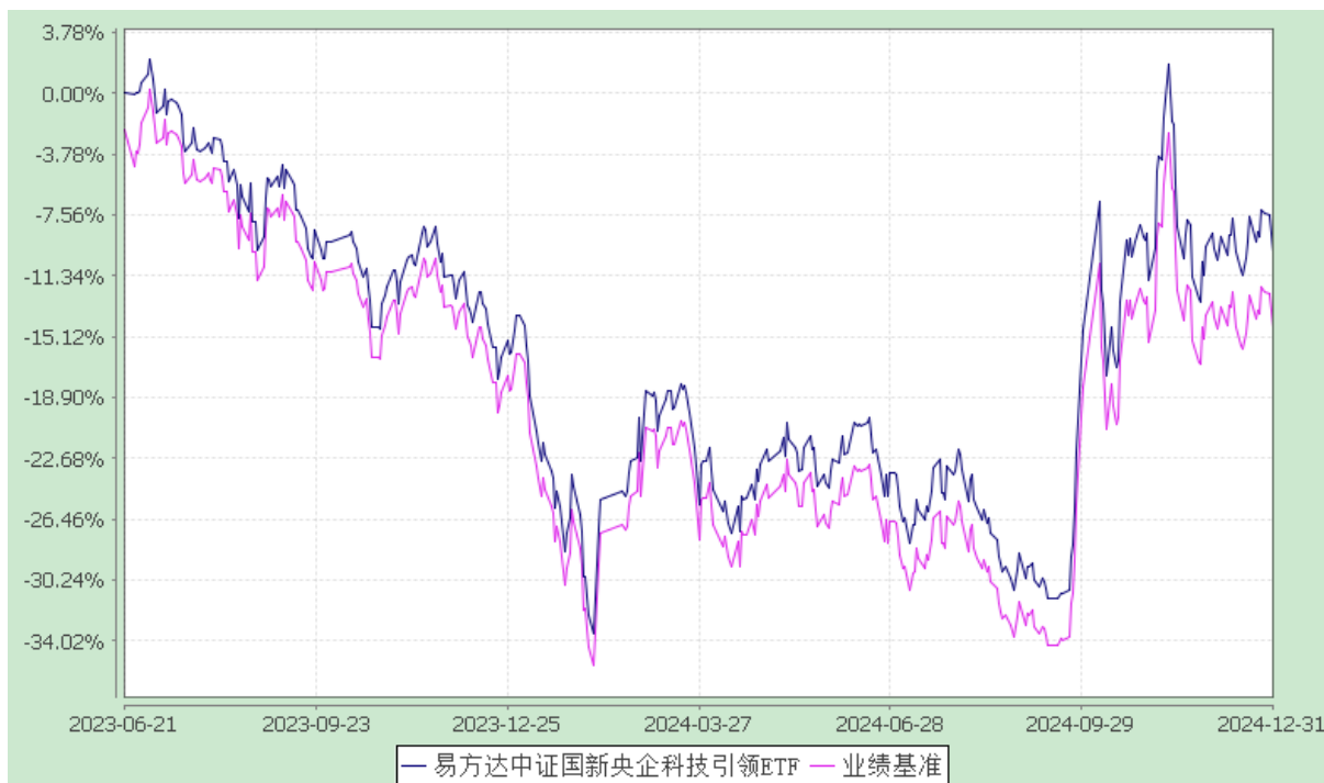
易方达中证国新央企科技引领交易型开放式指数证券投资基金 份额累计净值增长率与业绩比较基准收益率历史走势对比图 (2023 年 6 月 21 日至 2024 年 12 月 31 日)

注：自基金合同生效至报告期末，基金份额净值增长率为-9.81%，同期业绩比较基准收益率为-14.55%。