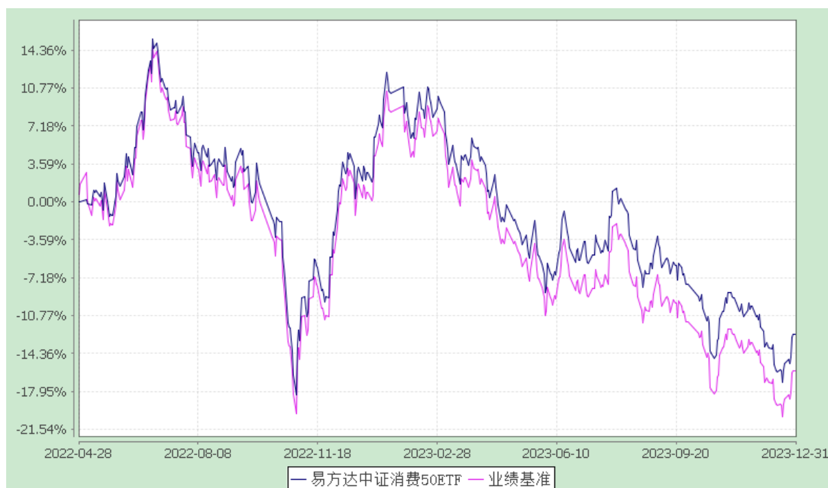
易方达中证消费 50 交易型开放式指数证券投资基金 份额累计净值增长率与业绩比较基准收益率历史走势对比图 (2022 年 4 月 28 日至 2023 年 12 月 31 日)

注：自基金合同生效至报告期末，基金份额净值增长率为-12.60%，同期业绩比较基准收益率为-15.99%。