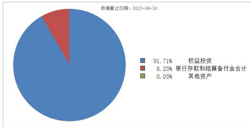
投资组合资产配置图表